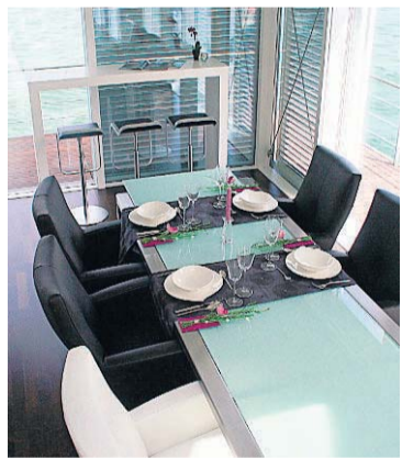
Ein Küchenmodul mit Essplatz wurde im Erdgeschoss des Musterhauses „ar-che“ eingerichtet.

Das Design-Büro WildeDesign hat das Modulhaus „ar-che“ speziell für das Projekt „Wohnhafen Scado“ entworfen. Entwickelt und gefertigt wurde es von den Unternehmen WildeMetallbau GmbH und steeltec37 (Massen / Berlin). Das freitragende, zweistöckige Haus mit einem Gewicht von 32 Tonnen und einer Firsthöhe von 6,85 Metern verfügt über eine Nutzfläche von 97 Quadratmetern sowie ein 22-Quadratmeter-Sonnendeck. Die Ver- und Entsorgung erfolgt über die 54 Meter lange Steganlage, an der weitere Häuser entstehen sollen. Ein luftgefüllter Stahlponton trägt das Haus auf dem Wasser.