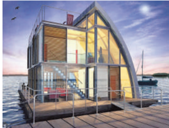
Das Modulhaus „ar-che“ der Firma steeltec37 aus Berlin wirkt wohltuend offen.