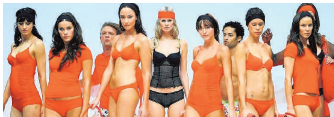
Kräftiges Orange dominiert auch bei den Dessous des Chemnitzer Herstellers Bruno Banani.

Laut Metzner sind viele Kollektionen von der Natur inspiriert - beherrscht werden sie von leichten Grün-Nuancen mit Millefleurs, floralen Tüllspitzen und Naturfasern wie Bambus oder biologisch gewachsene Baumwolle. „Das Rauschen des Meeres“ und die Ruhe in der Natur, aber auch „das üppige Grün eines ‚Tropengartens‘“ zitiert der Kollektionsbericht von Calida aus der Schweiz. Mutigere wählen kräftigere Farben vor allem aus der Wasserwelt.