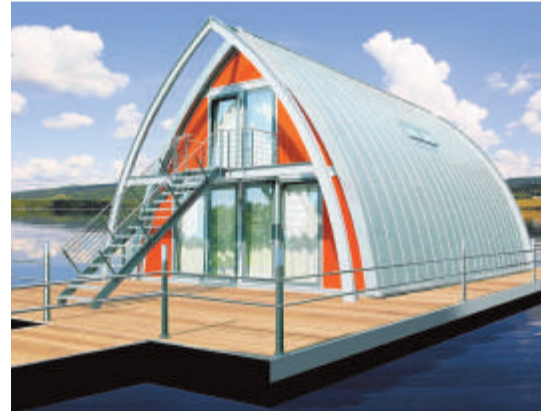
Wie „ar-che“, so kann auch das „go-tic“-Haus auf dem Wasser und an Land gebaut werden.