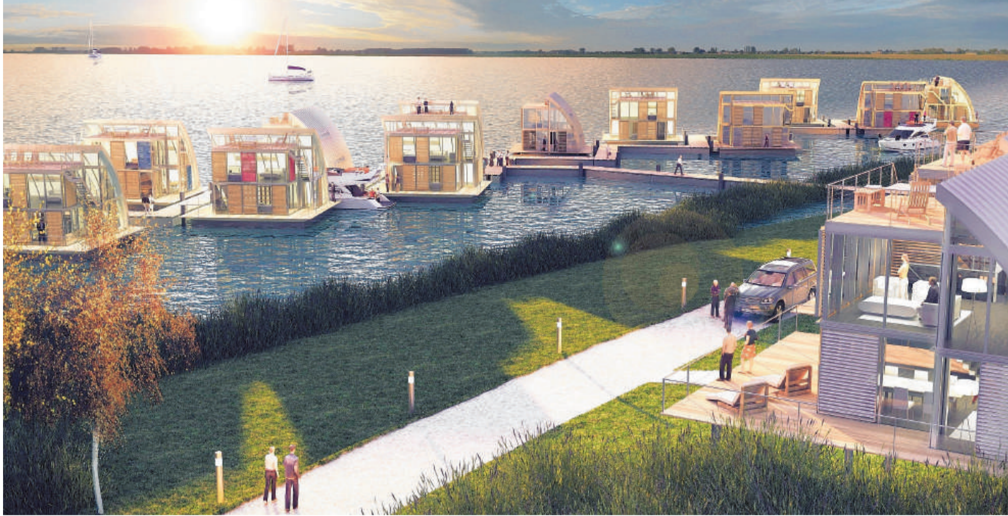
Gleich einen ganzen Wohnpark auf dem Wasser hat die Berliner Firma steeltec37 projektiert. In Erinnerung an eine Gemeinde, die der Braunkohle weichen musste, heißt das Projekt Scado.

Für die Nintendo DS sind wieder neue Titel erschienen, die im Fall von „Der Herr der Ringe - Die Eroberung“ und „Castlevania: Order of Ecclesia“ dem Action-Genre entstammen. Mit dem Aufbauspiel „Hotel Giganten DS“ gibt es aber auch Neues für Strategen. Und ein Lernspiel für Sprachkurs-Besucher ist mit „Mein Chinesisch-Coach“ auf dem Markt. Das Programm lehrt die Aussprache von Buchstaben und Wörtern bis hin zur Übersetzung ganzer Sätze. Das Ubisoft-Spiel enthält 1 000 Lektionen, in denen 10 000 Vokabeln und 1 500 Sätze gelehrt werden. DPA